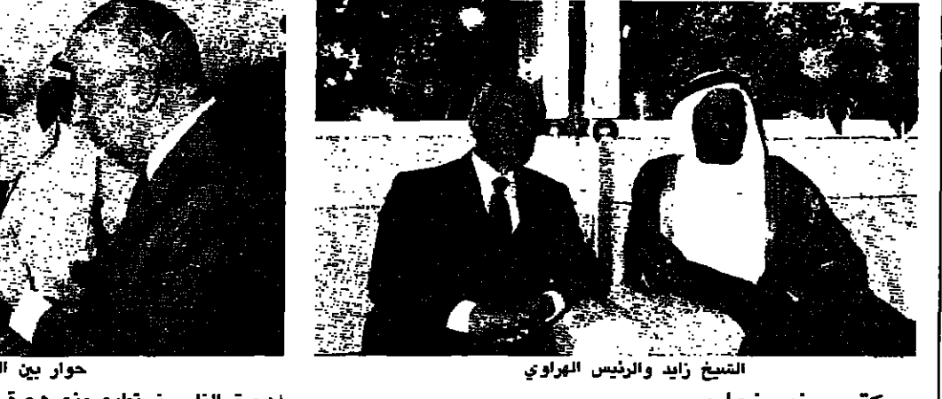
حوار بين الهراوي وامير البحرين الشيخ زايد والرئيس الهراوي

الجمعة التي قام بها الرئيس اليراس الهراوي والكوتوسليم الحص الى بعض دول الخليج العربي . كانت من ضمن استراتيجيته تحرك لاجراء اتصالات مباشرة مع كل الدول العربية - وان كانت الكويت وقطر والبحرين وابو ظبي - وهي المحطة الثانية بعد مصر وليبيا وتونس . فهناك محطة ثالثة هي الارض وسطي واليمن . ويضع الرئيس الهراوي امامه استراتيجية تحرك لجعله دول المجموعة الاوروبية والولايات المتحدة امريكية . كون استكمال تحركه العربي حيث من المتوقع ان تتم المحطة الثالثة في اوجز اب المقبل . ويقول الرئيس الهراوي في محاسنه الخاصة انه على استعداد تام لزيارة اية عاصمة عربية عشرات المرات في سبيل مصلحة لبنان واللبنانيين . ويعلم ان الجولتين الاولى والثانية قام بهما حتى الان غير منصفتين . ولهما الاهداف ذاتها والغايات نفسها والجولة العربية الثالثة ان تكون منفصلة عنهما . والهدف من هذا التحرك . عرض قضيتنا كما نراها وكما نقرها ومناقشتها مع الاصدقاء العرب لجلانها والبحث في تطوراتها . والهدف واحد هو الحصول على اكبر قدر من الدعم على الصعيد السياسي والاقتصادي والامنية وغير ذلك . ليكون لدى الامم الاقوامية العرب فهم واحد للقضية اللبنانية . لتساعدنا على تحطيق العقبات التي لا تزال تعترض حل القضية اللبنانية . والرئيس الدكتور سليم الحص يقول كلاما مشابها لكلام الرئيس الهراوي . ويؤكد ان هذه الجولة العربية والجولة الاخرى تطورات وقد تشير عنوانين الحديث بين الجولة والجولة . لكن الجوهر هو نفسه .